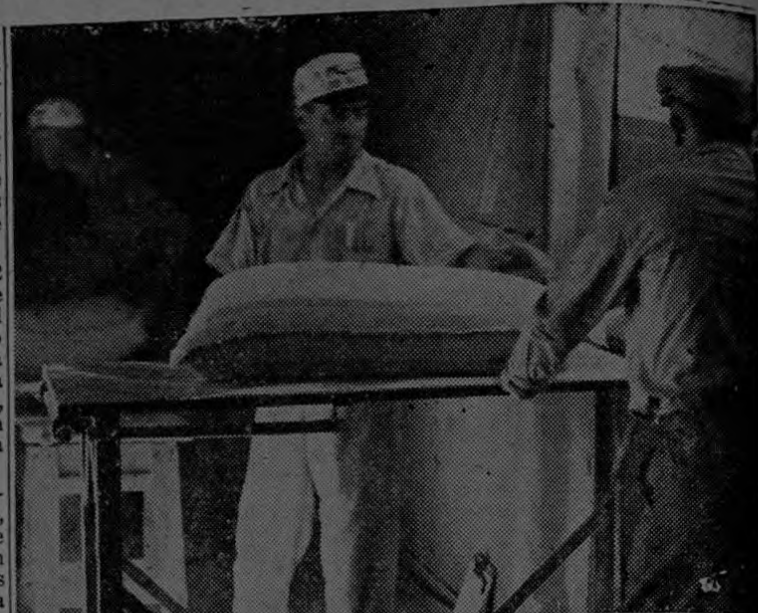
Los molineros de los Estados Unidos se aprestan a distribuir harina más oscura para el consumo civil.

En la actualidad, varios países del continente americano que ordinariamente dependen de la República Argentina para sus importaciones de trigo, han estado sufriendo graves carestías de dicho producto. Siempre que las circunstancias lo han permitido los Estados Unidos han facilitado cantidades adicionales; pero los representantes del gobierno manifiestan francamente que, debido a los importantes envíos a los pueblos asolados por la guerra, será imposible facilitar el