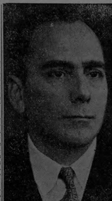
Dr. Alberto Arco Parro

Los últimos detalles para el nuevo censo quedarán ultimados a fines de 1947 o a principios de 1948, en la reunión de funcionarios técnicos de los diferentes países del Hemisferio, que tendrá lugar bajo los auspicios del Instituto Interamericano de Estadística. Este Instituto está constituido por preeminentes estadísticos de las naciones del Nuevo Mundo. Los estudios preliminares de los